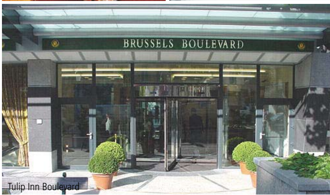
Tulip Inn Boulevard